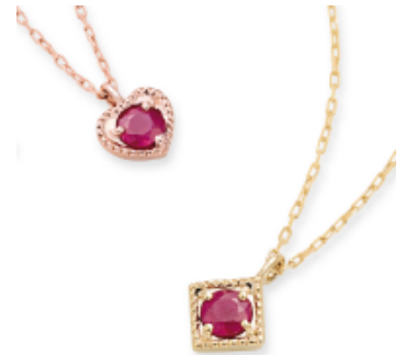
お誕生日 を祝う 瞬間