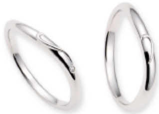
新しい家族 が生まれる 瞬間